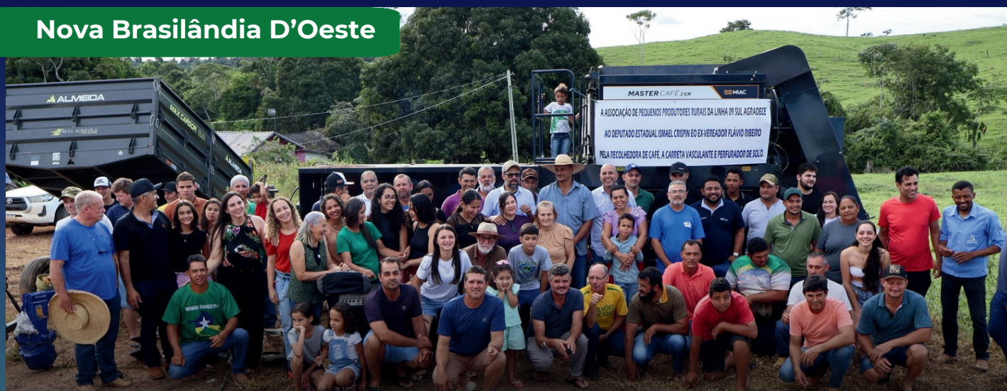
Associação de pequenos produtores rurais

A Associação de Pequenos Produtores da Linha 09 Sul recebeu novos equipamentos agrícolas que aumentam a produção, reduzem o esforço físico e transformam a rotina das famílias rurais.