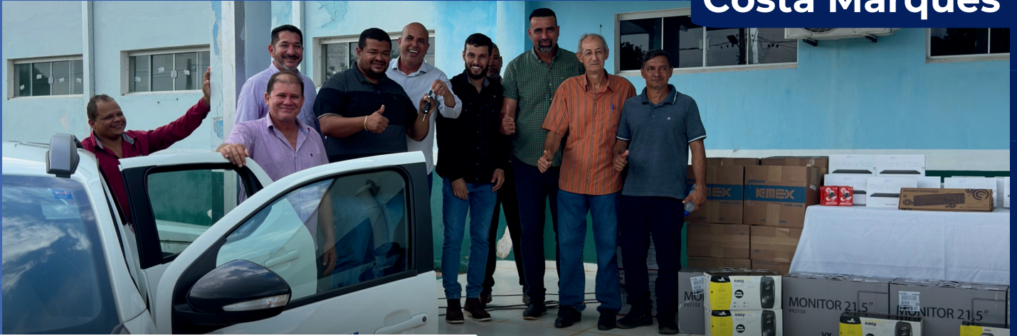
Hospital Municipal de Costa Marques

Modernizar a saúde é cuidar melhor de quem precisa. O Hospital Municipal recebeu novos equipamentos e tecnologia que fortalecem o atendimento e tornam o serviço mais ágil e eficiente para toda a população.