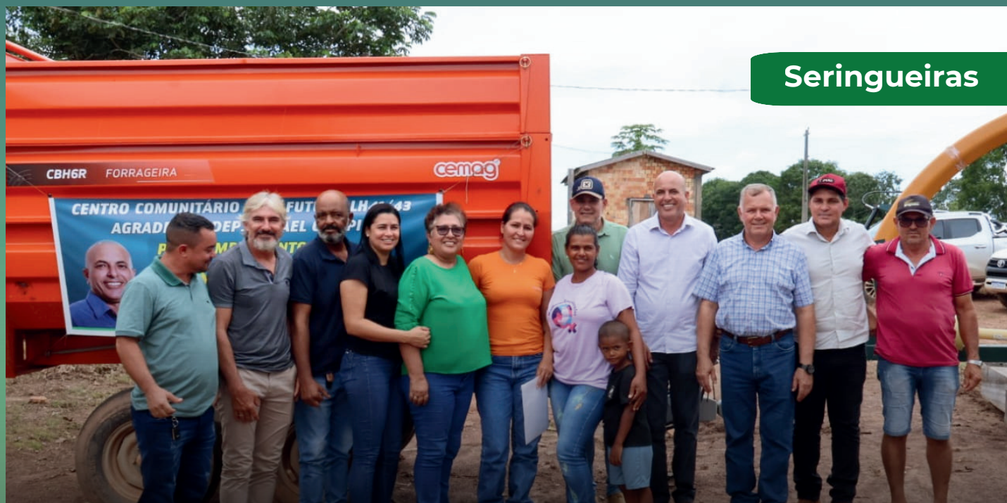
Centro Comunitário Bom Futuro

O Centro Comunitário Bom Futuro recebeu novos equipamentos agrícolas que fortalecem o trabalho no campo, melhoram a produtividade e garantem melhores condições para as famílias atendidas.